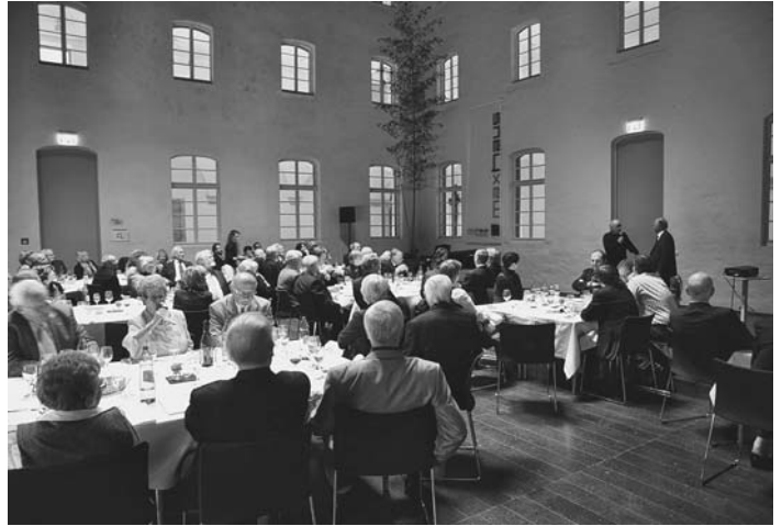
...und bei der Feier im Klosterhof.