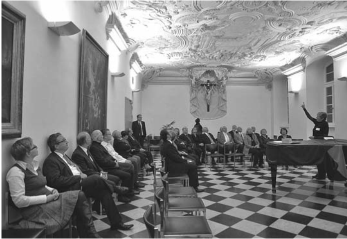
Die Gäste im prächtigen Antoniussaal...