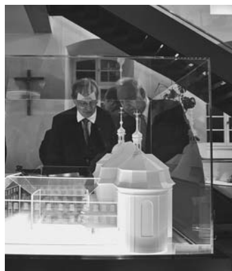
Architekturmodell in der Ausstellung.

Die Franziskaner als Bettelorden machten sich bei den Düsseldorfern schnell beliebt, vor allem durch Krankenpflege und Schulunterricht, auch für die ärmere Bevölkerung. Heinrich Heine, 1797 geboren, besuchte